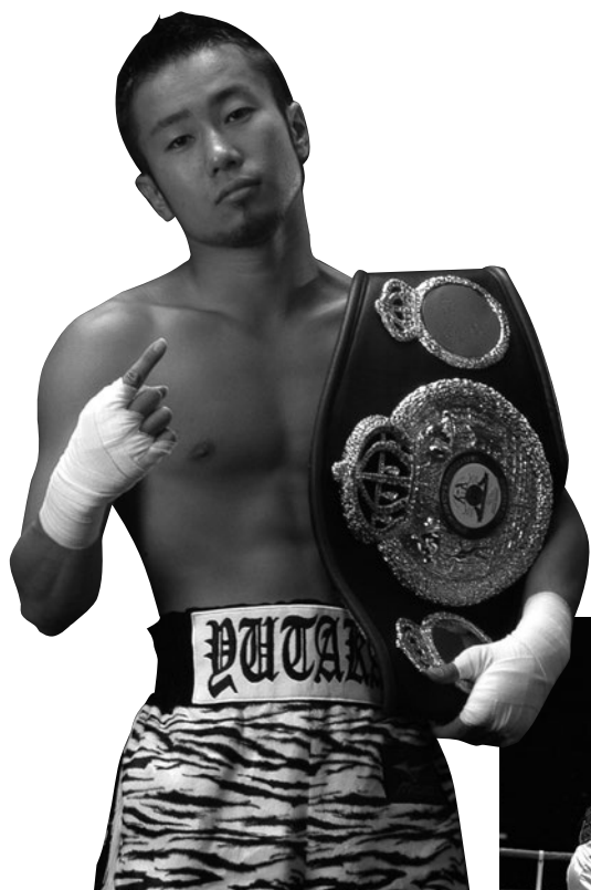
●新井田 豊 (元WBA世界ミニマム級チャンピオン)